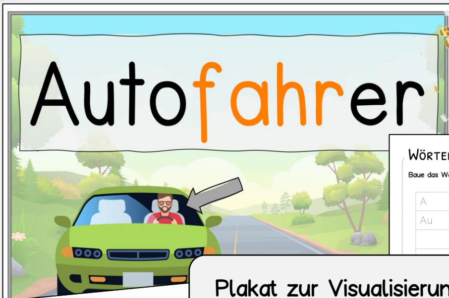
Plakat zur Visualisierung Rechtschreib-Arbeitsblätter

WÖRTERTRAINING „AUTOFAHRER“ NAME: ..... Blatt 18